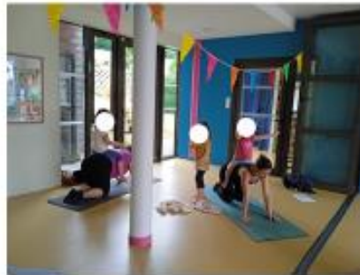
Atelier yoga enfants/ parents 22/06/24