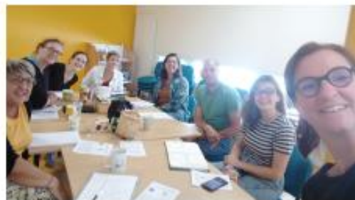
Première réunion jeudi 05/09/24